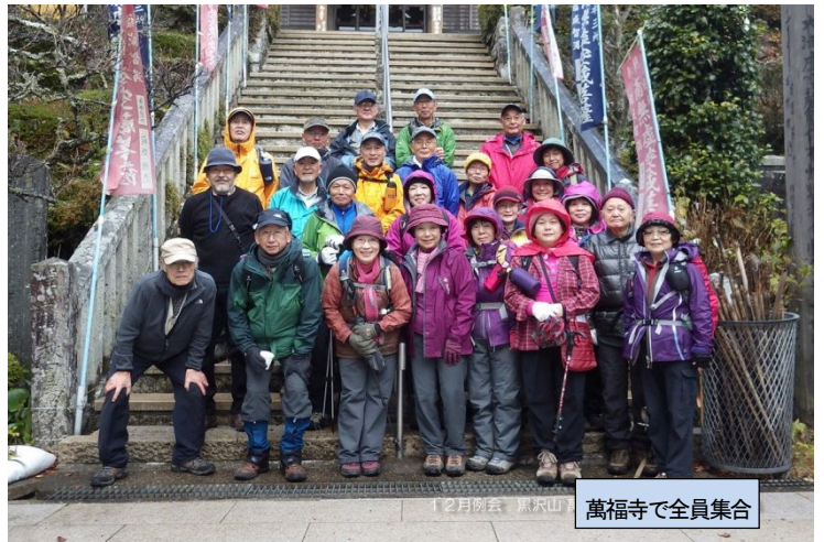
萬福寺で全員集合

であった。道の両脇の木々にうっすらと雪があり、談笑しながらの歩きであり、やがて「稜線分岐」に到着した。萬福寺の