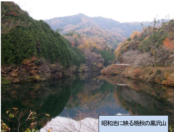
昭和池に映る晩秋の黒沢山

であった。道の両脇の木々にうっすらと雪があり、談笑しながらの歩きであり、やがて「稜線分岐」に到着した。萬福寺の