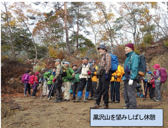
黒沢山を望みしばし休憩

昭和池の南堤に9時30分に集合した。参加者は24名である。開会行事等を終えて登山行動に移る。登山道の標識に従って林道を歩く。檜や杉の植林帯の中を歩き山田口分岐に到着。衣服調整をする。林道が整備されていて歩きやすい。時折落ちてくるしずくも興をそそるもの