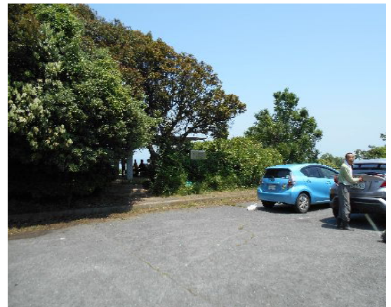
金甲山駐車場清掃後