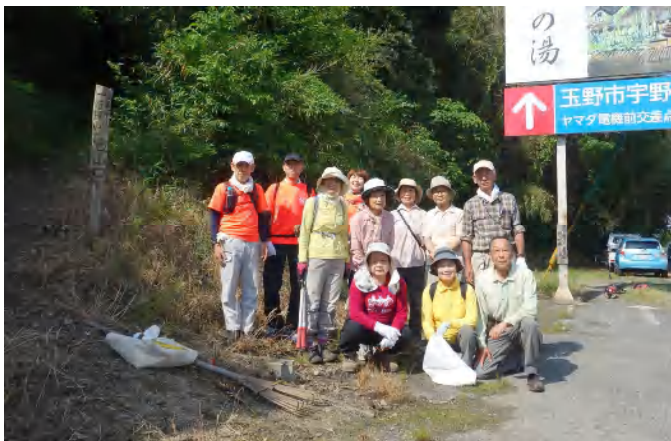
怒塚山駐車場集合