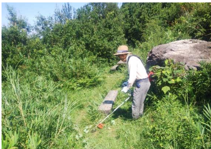
山頂広場ベンチの草刈