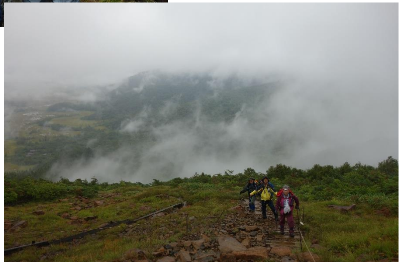
尾瀬ヶ原は眼下に！