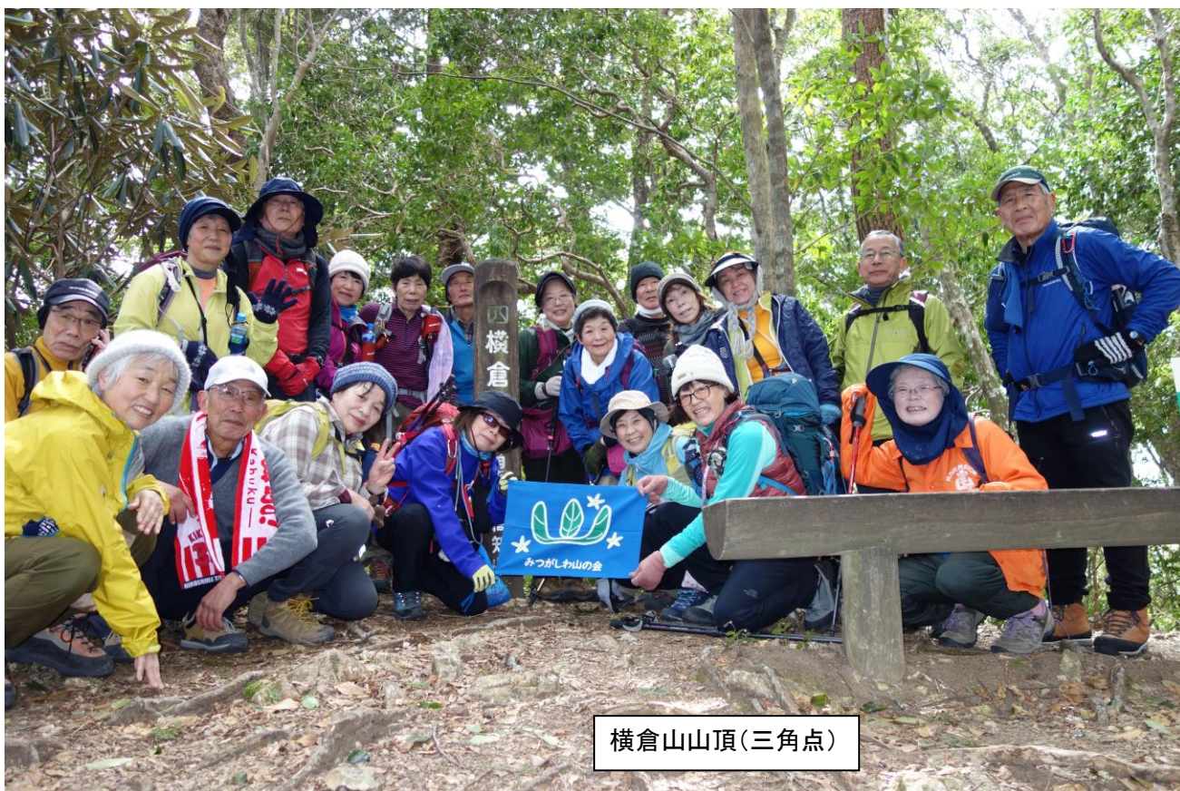
横倉山山頂(三角点)