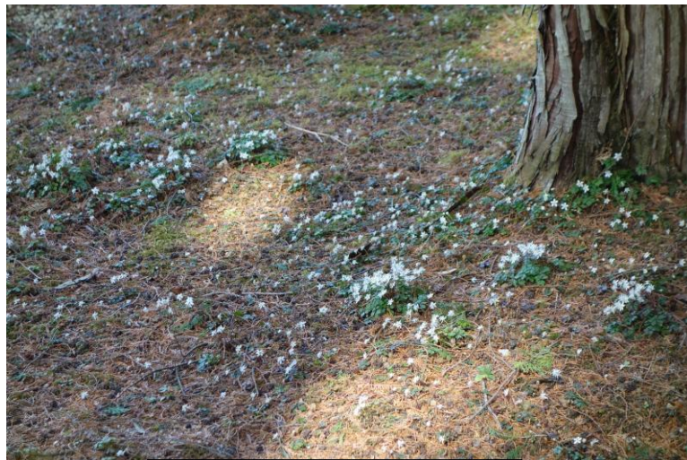
牧野公園バイカオウレンの群生