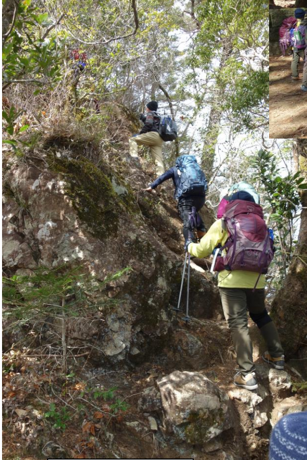
横倉山へ向かう急登