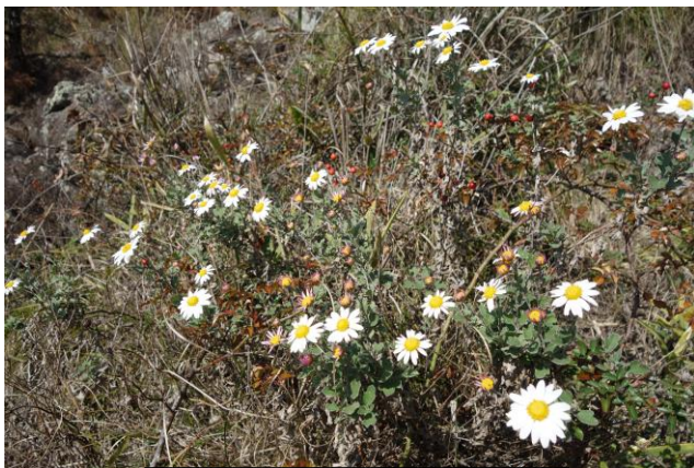
ノジギクとサンキライ