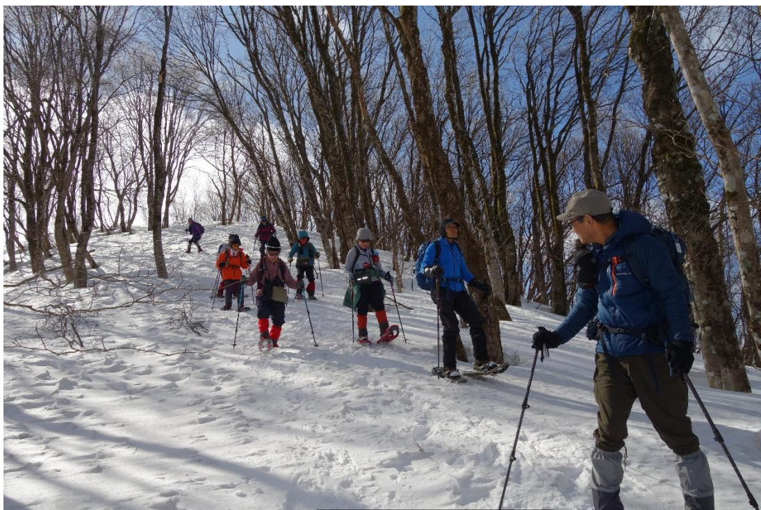
大畝山から御林山へ