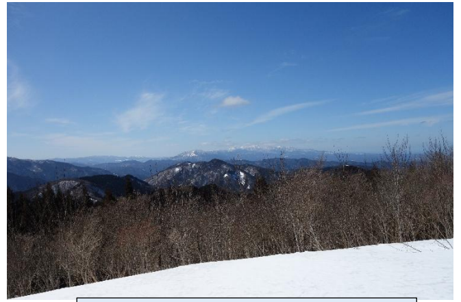
高清水頂上から見る大山・蒜山